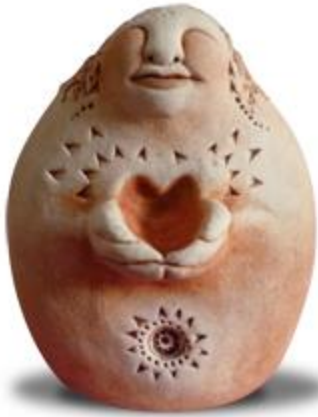
Statue de Debbie Berrow www.bellpineartfarm.com