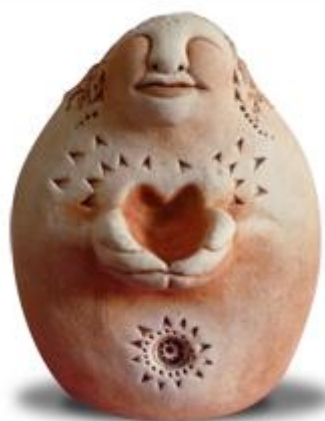
Statue by Debbie Berrow www.bellpineartfarm.com